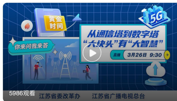
从通信塔到数字塔 "大块头"有"大智慧"