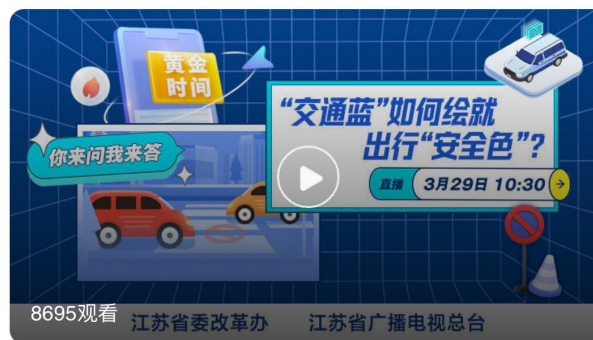
“交通蓝”绘就出行“安全色”